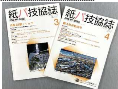
写真 1 キャプション・・・または Photo. 1 キャプション・・・